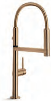
Red canyon PVD