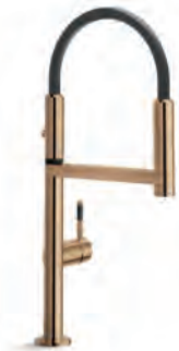
Red canyon PVD