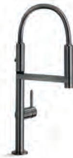
Diamond smoke PVD