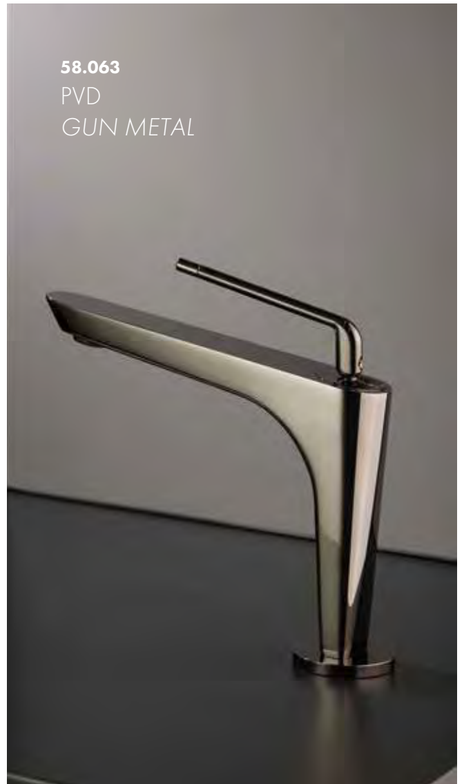
58.063 PVD GUN METAL