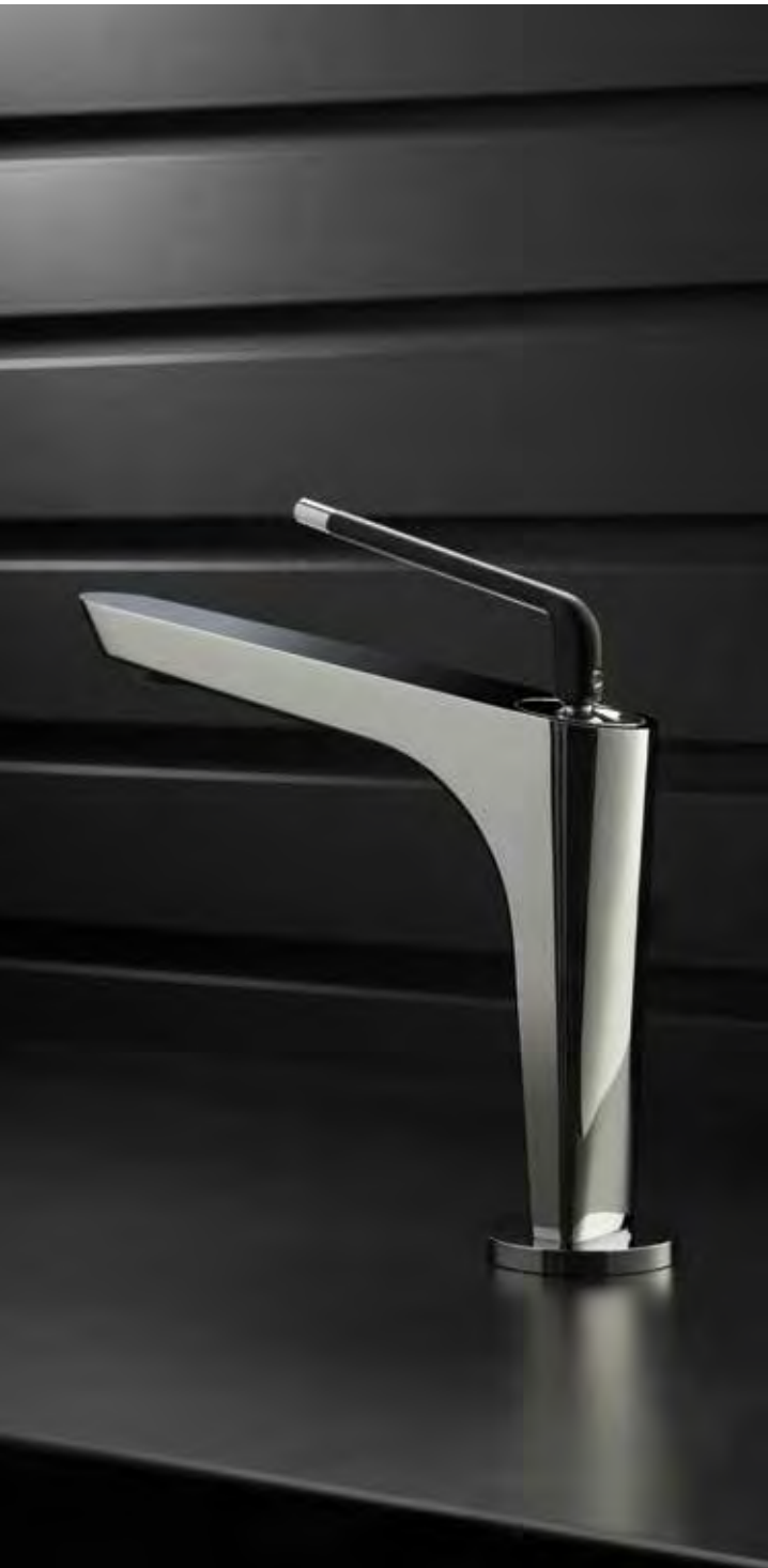
05.093 CROMO - NERO OPACO CHROME - MATT BLACK