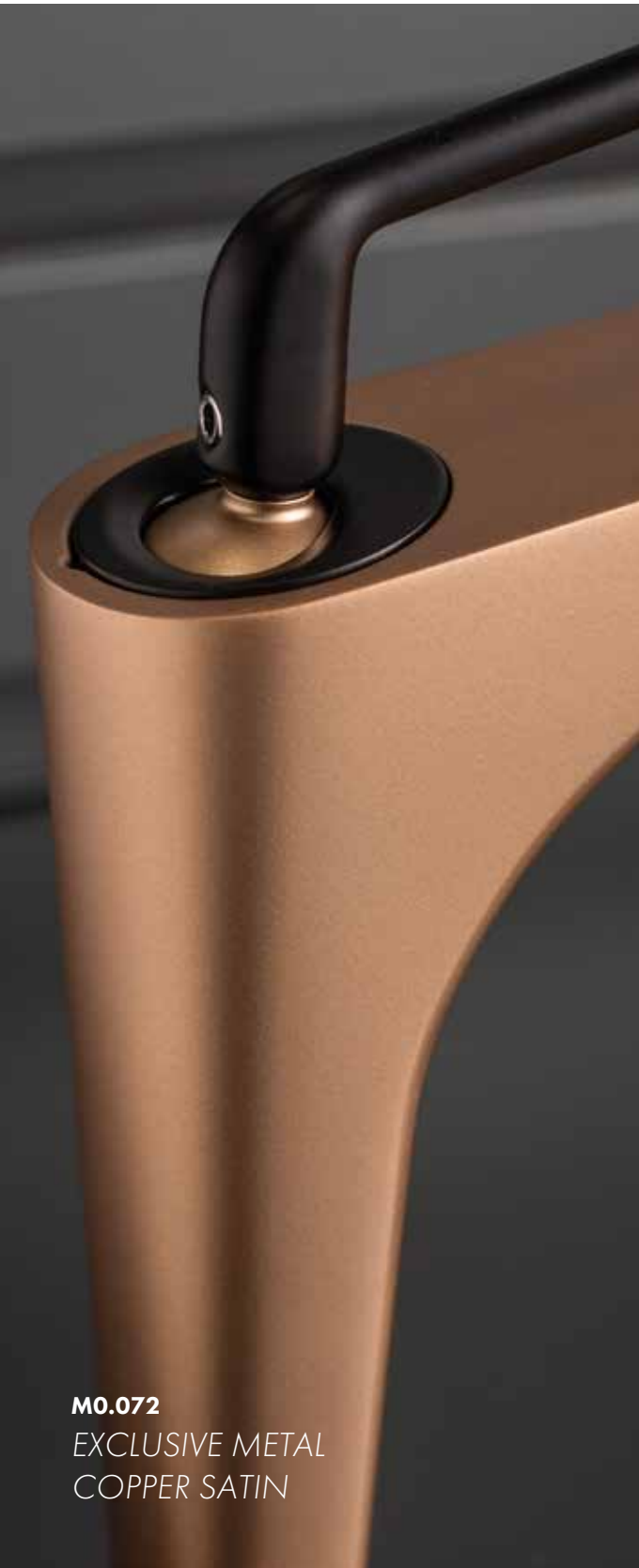
M0.072 EXCLUSIVE METAL COPPER SATIN