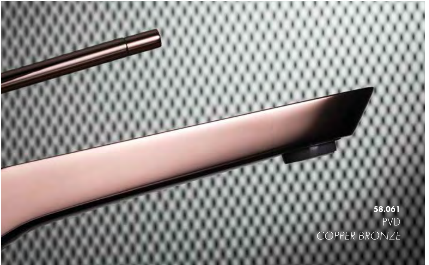
58.061 PVD COPPER BRONZE