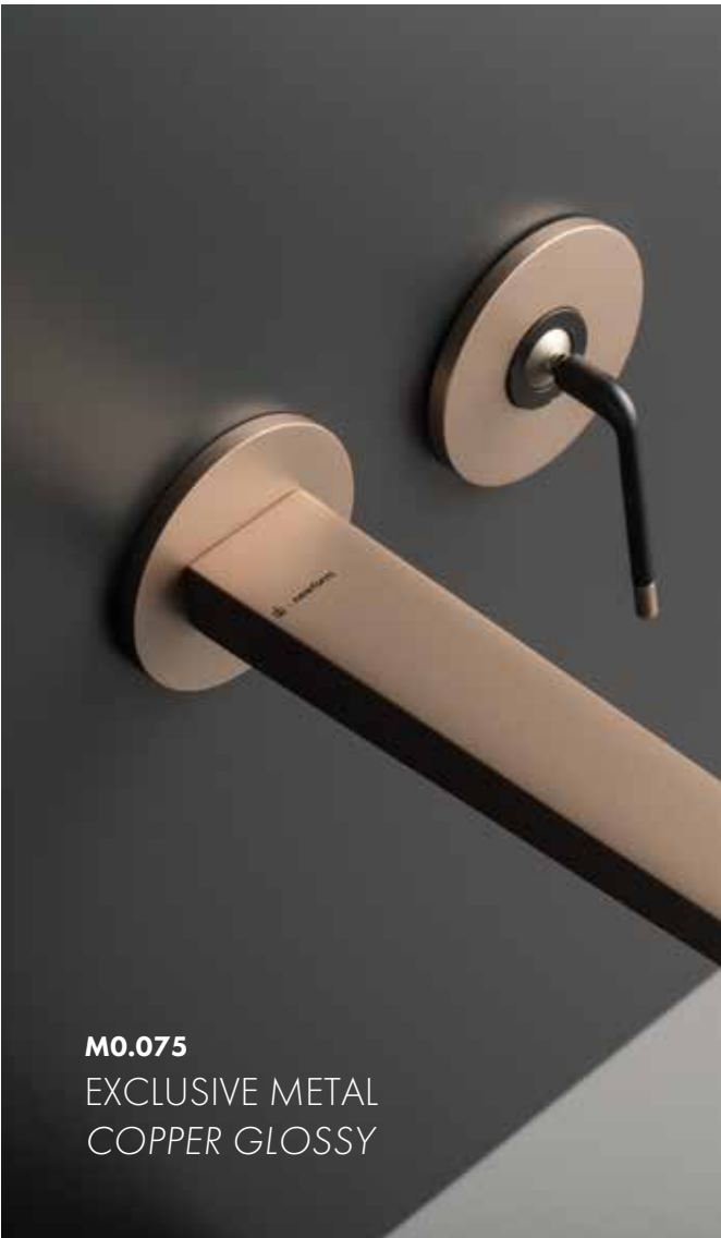
M0.075 EXCLUSIVE METAL COPPER GLOSSY