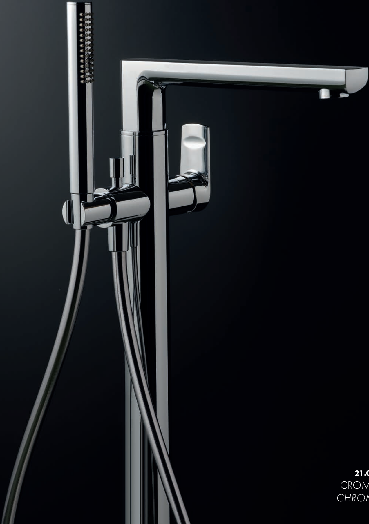
21.018 CROMO CHROME